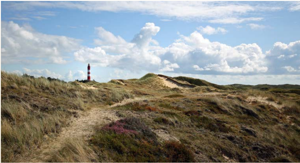
Dünenlandschaft von Amrum