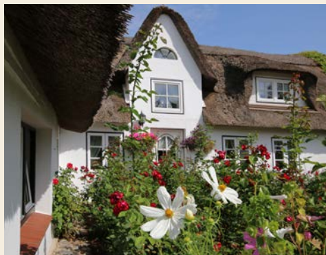
Typisches Friesenhaus auf Amrum