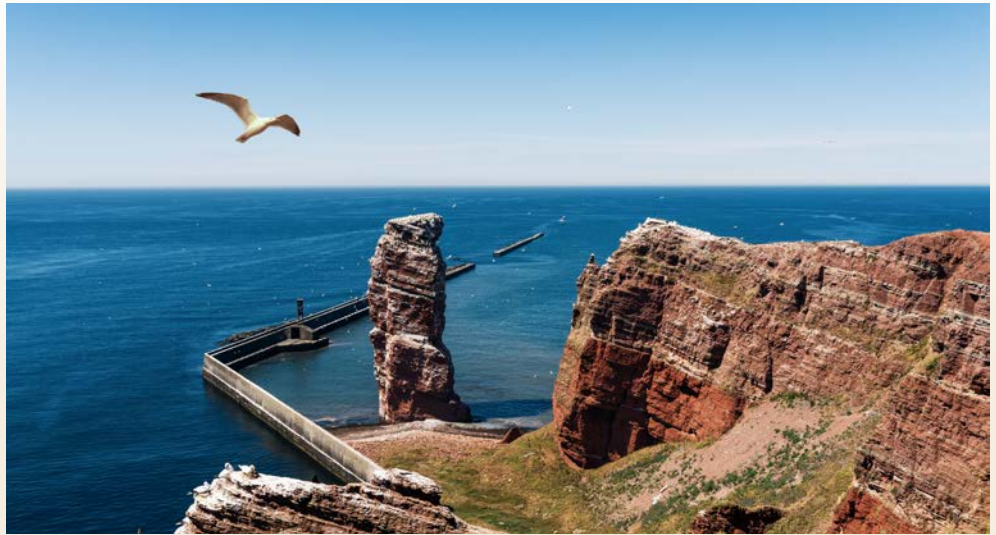
Lange Anna auf Helgoland

Liebe Leserin, lieber Leser, Expedition in Deutschland? Das geht und die QUEST nimmt Sie mit auf eine ganz besondere Seereise! Erkunden Sie die Schönheit der Nordsee und des Weltkulturerbes Wattenmeer mit seiner Insel- und Halligwelt. Gehen Sie noch in diesem Jahr mit an Bord des Premium-Expeditionsschiffes auf eine noch nie dagewesene Expeditionsreise. Gemeinsam mit Experten erleben Sie die Vielfalt und die Besonderheiten der Inseln Sylt, Amrum und Helgoland sowie die faszinierenden Halligen. Mit lediglich 48 Gästen bietet die QUEST den perfekten Rahmen für traumhafte Erlebnisse im kleinen Kreis. Lernen Sie auf eine einmalige Art und Weise die Einzigartigkeit dieser Region – vor Ort und an Bord – kennen. Das umfangreiche Programm wurde für Sie von erfahrenen Expeditionsleitern, Naturguides sowie lokalen Gästeführern zusammengestellt. Die abwechslungsreiche Verpflegung rundet Ihre Reise ab – machen Sie sich bereit für eine Expedition mit ganz besonderen Momenten!