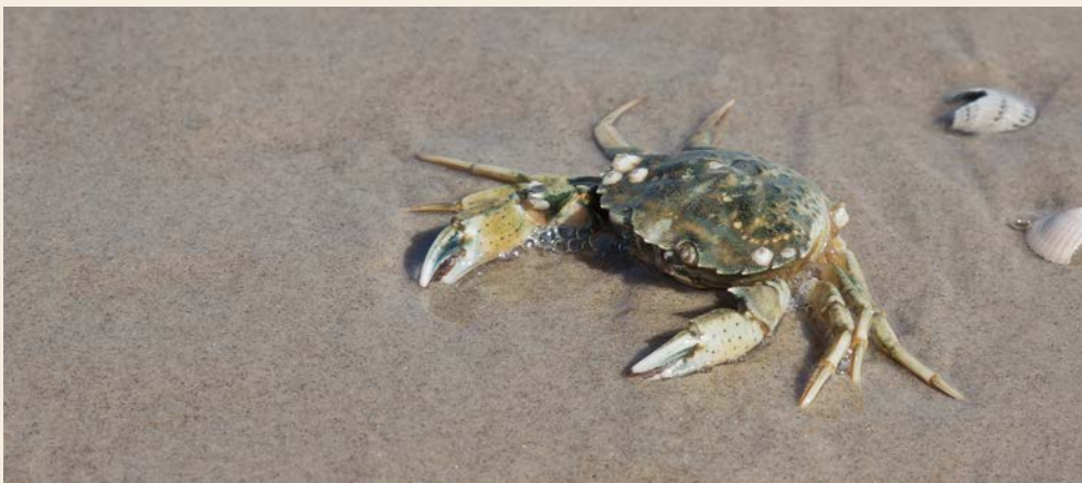
Bewohner des Wattenmeeres