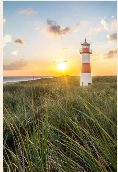
Abendliche Impressionen auf Sylt

Nach einem ausgiebigen Frühstück wird am Morgen die größte Kegelrobbenkolonie Deutschlands auf der Helgoländer Düne besucht. Am „Lummenfelsen“ – dem kleinsten Natur- und Vogelschutzgebiet Deutschlands – wird Ihnen von Experten die indigene Vogelwelt (Basstölpel, Dreizehnmöwe, Eissturmvogel, Tordalk und Trottellumme) eindrucksvoll erläutert. Noch bevor die zahlreichen Ausflugschiffe die Insel erreichen, geht es „Anker auf“ – die QUEST nimmt Kurs auf List/Sylt. Auf halber Strecke wird ein Stopp an den großen Offshore-Windparks eingelegt. Die Route führt weiter von der Sylter Westküste bis zum Lister Ellenbogen, dem nördlichsten Punkt Deutschlands. Nach Erreichen der Reede am Abend besteht die Möglichkeit eines Landganges am Lister Hafen.