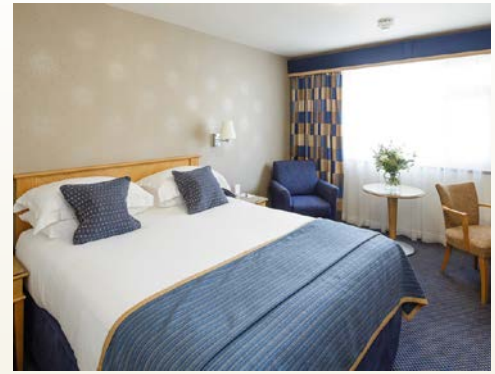
Zimmerbeispiel im Hotel