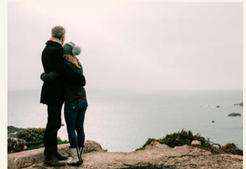
Genießen Sie die Aus- und Augenblicke

Cream Fudge!). Der Nachmittag steht zu Ihrer freien Verfügung. Empfehlenswert ist ein Besuch der Festungsanlage Elizabeth Castle, die Sie von St. Helier aus gezeitenabhängig bequem zu Fuß oder mit einem Amphibienfahrzeug erreichen können. Für Geschichtsinteressierte bietet sich der Zusatzausflug zu den War Tunnels an: In dieser mehrfach preisgekrönten Ausstellung wird die Besatzungszeit durch deutsche Truppen während des zweiten Weltkriegs mit Original-Mobiliar, Ton- und Bilddokumenten in bewegender Weise lebendig.