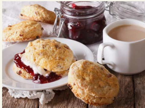
Scones mit Cream Tea – einfach lecker

Die Zimmer sind komfortabel und mit LCD-TV, Telefon, Klimaanlage sowie einem Kaffee-/Teetzubereiter, Bad und Haartrockner ausgestattet.