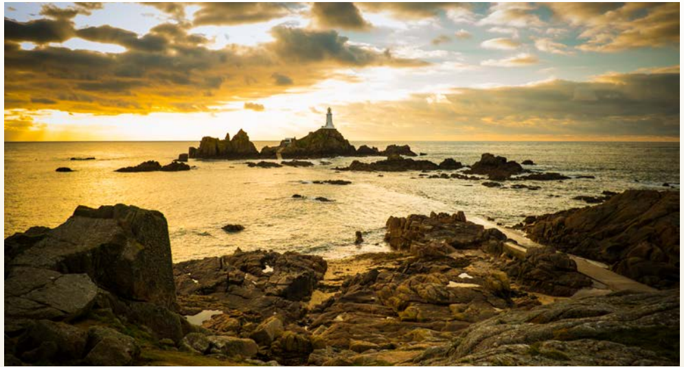
Leuchtturm La Corbière