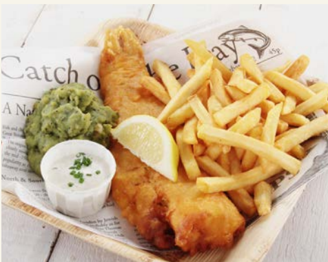
Fish & Chips – einfach lecker!