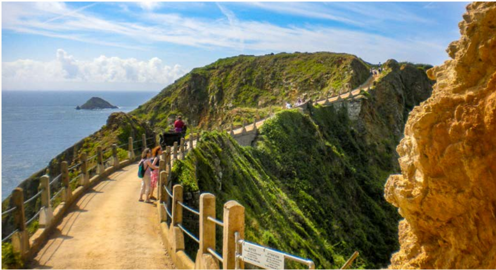
La Coupée – spektakulärer Übergang zwischen Sark und Little Sark