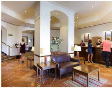
An der Rezeption