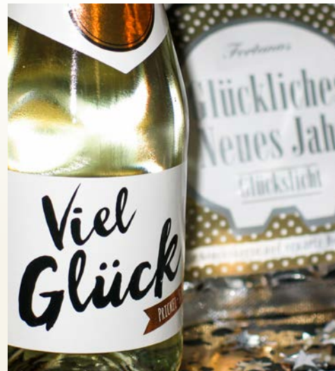
Frohes Neues Jahr!

am Ladungsaufkommen, den zweitgrößten Hafen Europas. Die Sehenswürdigkeiten, wie Brabobrunnen, Eisenbahnkathedrale des alten Hauptbahnhofes, Liebfrauenkathedrale ..., runden das Juwel gebührend ab. Das buchbare Ausflugs paket nimmt die Teilnehmer mit auf eine Stadtrundfahrt.