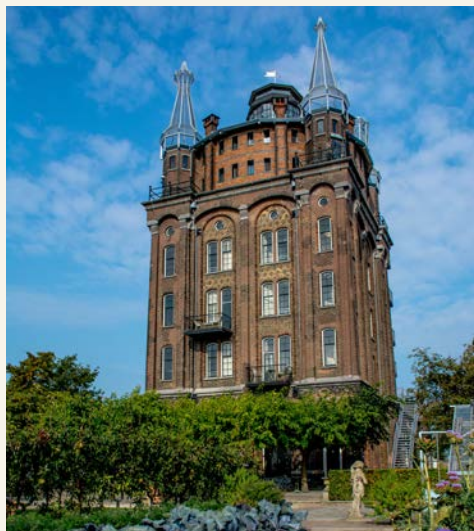
Groothoofdspoor in Dordrecht

Willkommen in einer der ältesten Städte der Niederlande! Dordrecht liegt in einem wasserreichen Gebiet an den Flüssen Merwede, Noord und Oude Maas, wodurch sie sich schon sehr früh zu einem wichtigen Handelsstandort für Holz, Korn und Wein entwickelte. Die Stadtrechte erhielt sie 1220. Noch heute spürt man den Wohlstand der damaligen Zeiten, rund 1.000 Baudenkmäler schmücken die Innenstadt, historische Packhäuser und Museen gilt es zu entdecken. Wenn Sie durch Dordrecht schlendern, verpassen Sie nicht die Grote Kerk, die hoch gepriesene Gemäldesammlung des Dordrechts Museums, die herrliche Innenausstattung der ehemaligen