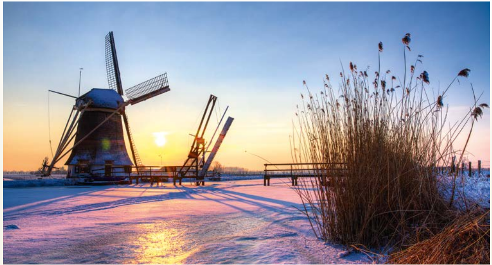
Windmühlen-Idylle funktioniert nicht nur im Sommer ...

Liebe Leserin, lieber Leser, erleben Sie den Jahreswechsel auf besondere Art während der entspannten Flussreise auf einem echten Deluxe-Schiff. Mit der SWISS SAPPHIRE geht es von Düsseldorf aus den Rhein und weitere Wasserwege entlang über Dordrecht nach Antwerpen. Die Weltstadt Amsterdam, erwartet Sie am letzten Tag des Jahres. Vielleicht haben Sie Lust auf eine Grachtenrundfahrt, bevor Sie am Abend stilvoll in das neue Jahr gleiten. Frohes Neues Jahr! Während Sie Ihren Neujahrsbrunch genießen, geht es weiter nach Rotterdam. Und auch der ältesten Stadt der Niederlande, Nijmegen, statten Sie einen Besuch ab.