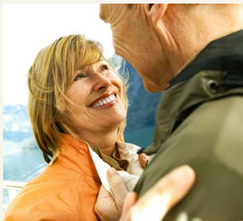
Wir wünschen Ihnen einen tollen Urlaub!

Am Morgen erreichen Sie Düsseldorf, wo Ihre Reise mit vielen neuen Impressionen im Gepäck endet. Ausschiffung nach dem Frühstück und Busfahrt zurück nach Berlin.