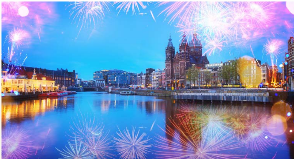
Freuen Sie sich auf Silvester in Amsterdam!