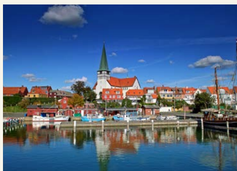
Rønne auf der Insel Bornholm

Nach dem Frühstück verabschieden Sie sich von Bornholm und erreichen mit der Fähre am frühen Mittag Sassnitz. Anschließend erfolgt der Bustransfer nach Stralsund und Sie treten die Rückreise nach Berlin an.