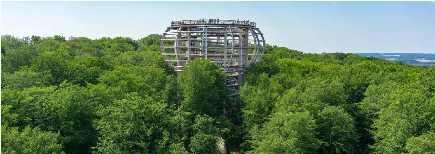
Baumwipfelpfad Rügen mit herrlichem Ausblick