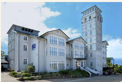
Hotel Hanseatic Rügen & Villen

Rügen: Das Hotel Hanseatic Rügen & Villen (Landeskategorie: 4 Sterne) bietet sich wunderbar für einen Urlaub an der Ostsee an. Die Zimmer sind großzügig geschnitten und verfügen über Bad mit Wanne oder Dusche, Haartrockner, Flatscreen mit Sat.-TV und Safe. Beim Frühstück bedienen Sie sich am reichhaltigen Buffet. Die Nutzung des Schwimmbades, der Sauna und des Fitnessbereichs ist für Sie natürlich inklusive.