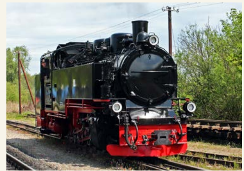
Dampflok des Rasenden Roland