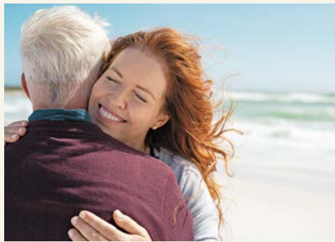
Genießen Sie Ihre Zeit an der Ostsee