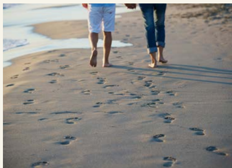
Wie wäre es mit einem Strandspaziergang?

Mit der Bahnfahrt nach Stralsund beginnt Ihre Reise in den hohen Norden. Nach der Ankunft am Nachmittag erwartet Sie Ihre Reiseleitung und es erfolgt der Bustransfer nach Rügen. Sie erreichen Göhren. Hier beziehen Sie Ihr Quartier für die nächsten zwei Nächte. Das Hotel Hanseatic Rügen & Villen zeichnet sich durch seine traumhafte Lage aus. Es liegt mitten im Biosphärenreservat auf einer ins Meer ragenden Landzunge, sodass Sie von fast allen Zimmern einen überwältigenden Blick auf die Insel und das Meer haben. Nach dem Check-in und dem Zimmerbezug bleibt Ihnen noch etwas Zeit, bevor das gemeinsame Abendessen im Hotelrestaurant eine gute Möglichkeit zum Kennenlernen der Mitreisenden bietet. Das Seebad Göhren befindet sich am östlichsten Punkt Rügens und verfügt über zwei Strände. Der Nordstrand ist breit, feinsandig und hier befindet sich auch die Seebrücke sowie die Strandpromenade. Die Wasserqualität ist gut und vielleicht haben Sie ja Lust, mit den Füßen das Wasser bei einem Abendspaziergang zu genießen. Im Ort selbst lohnt sich ein Besuch der Dorfkirche und auch das Heimatmuseum freut sich über einen Besuch. Sie sehen schon: hier findet jeder etwas zu entdecken oder die Seele baumeln zu lassen.