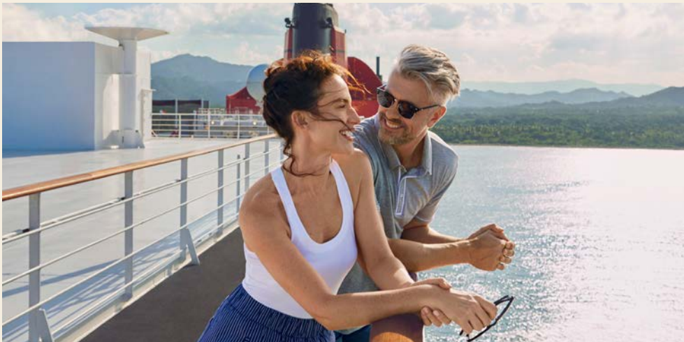
Genießen Sie Ihre Zeit an Board

5. Tag, Donnerstag, 15. Juli 2021 Hamburg – Ausschiffung – Rückreise nach Berlin Die QUEEN MARY 2 erreicht ihren heimlichen Heimathafen Hamburg. Seit Jahren verbindet die Hamburger und die QUEEN MARY 2 eine ganz besondere Beziehung. Nach der Ausschiffung erfolgt die Busfahrt nach Berlin.