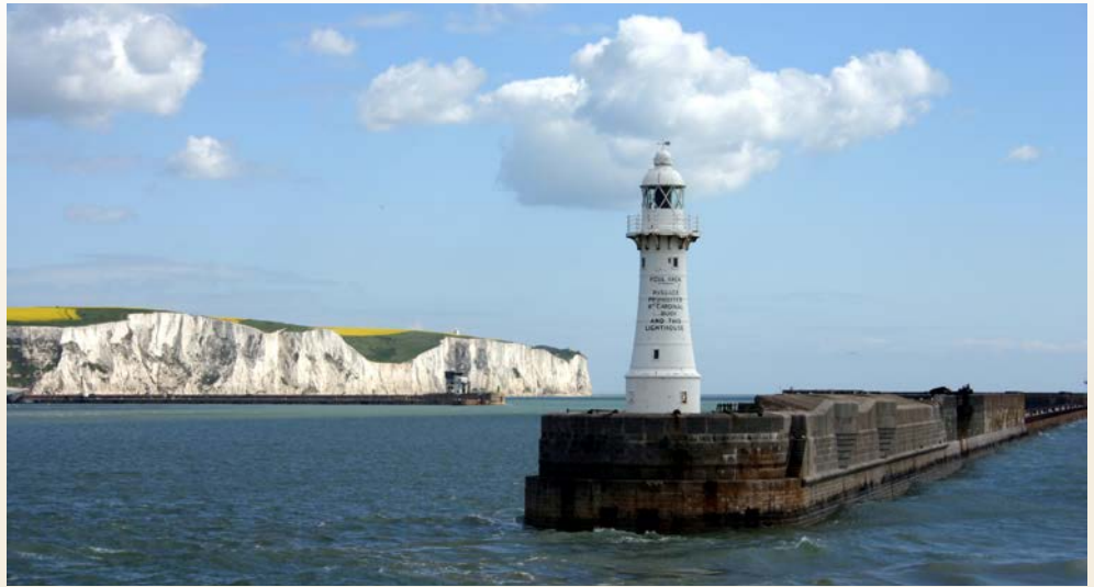
Die berühmten Weißen Klippen von Dover

Liebe Leserin, lieber Leser, diese Reise ist etwas ganz Besonderes! In Calais setzen Sie mit der Fähre nach Dover über und erreichen England. Hier erwartet Sie eine Übernachtung in einem tollen 4-Sterne Hotel in der Grafschaft Kent und eine Gartentour zum Hever Castle mit Besichtigung. Ihr nächstes Ziel: London. Bei einer Stadtrundfahrt entdecken Sie die pulsierende Weltmetropole mit all Ihren Sehenswürdigkeiten. In Southampton begrüßt Sie dann die QUEEN MARY 2. Kein anderes Schiff verkörpert das elegante Ambiente eines klassischen Oceanliners mehr als sie. Genießen Sie das „königliche“ Flair an Bord, bevor Sie im heimlichen Heimathafen Hamburg einlaufen.