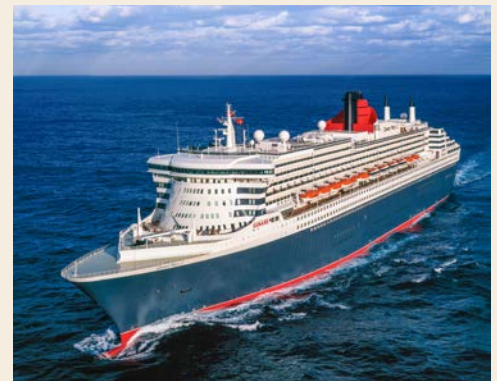
Die QUEEN MARY 2

Historisch und doch modern, multikulturell und zugleich ganz traditionell – Sie befinden sich in einer der spannendsten Städte Europas! St. Paul's Cathedral, Westminster Abbey, Buckingham Palace, Downing Street, Whitehall, Tower of London, Big Ben, Houses of Parliament, Piccadilly Circus, Trafalgar Square ... die Höhepunkte Londons nehmen kein Ende und werden doch nie langweilig. Diese und viele weitere Sehenswürdigkeiten werden Ihnen auf Ihrer Stadtrundfahrt nähergebracht. Anschließend erfolgt der Transfer nach Southampton, hier erwartet Sie schon die QUEEN MARY 2 zur Einschiffung. Majestätisch, elegant, formvollendet – genießen Sie diesen ersten Tag an Bord und kosten Sie das herrliche Gefühl, den Alltag hinter sich gelassen zu haben, richtig aus.