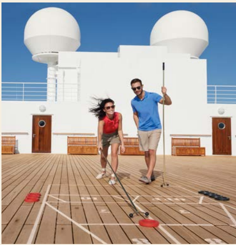
Wie wäre es mit einer Partie Shuffleboard

– dem ersten Planetarium auf See. Und wohin Ihre Wege Sie auch führen: Der legendäre White Star Service™ ist ein Garant dafür, dass Sie sich rund um die Uhr wunschlos glücklich fühlen. Aus dem bisherigen „Winter Garden“ z.B. ist die neue Carinthia Lounge entstanden – elegant und luftig, tagsüber ein Ort zum Entspannen bei leichten Speisen, abends eine elegante Premium-Weinbar mit zwanglosem Unterhaltungsprogramm.