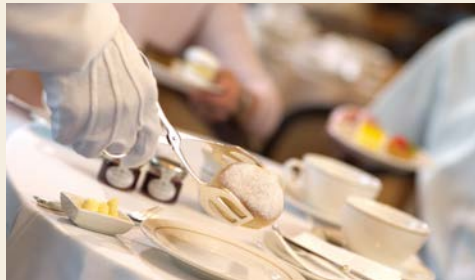
Lassen Sie sich rundum verwöhnen

– dem ersten Planetarium auf See. Und wohin Ihre Wege Sie auch führen: Der legendäre White Star Service™ ist ein Garant dafür, dass Sie sich rund um die Uhr wunschlos glücklich fühlen. Aus dem bisherigen „Winter Garden“ z.B. ist die neue Carinthia Lounge entstanden – elegant und luftig, tagsüber ein Ort zum Entspannen bei leichten Speisen, abends eine elegante Premium-Weinbar mit zwanglosem Unterhaltungsprogramm.