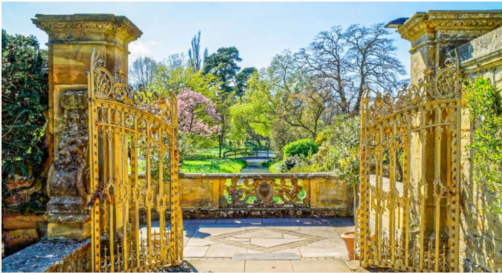
Gartenanlage von Hever Castle