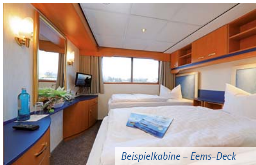
Beispielkabine – Eems-Deck