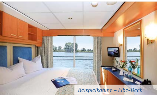
Beispielkabine – Elbe-Deck