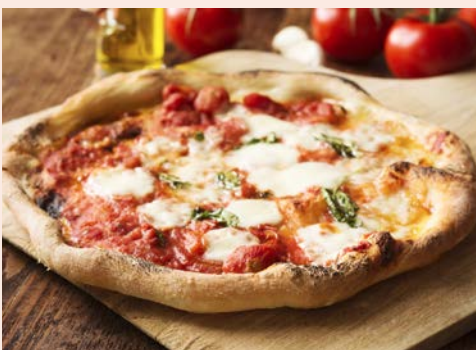
Ein Klassiker – Pizza Napoletana