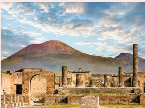
Pompeji – ein Muss für jeden!

Sie gilt zu Recht als eine der schönsten Inseln des Tyrrhenischen Meeres. Capri hat bis heute nichts von seiner Anziehungskraft verloren. Der Ausflug auf die Insel startet mit einer Busfahrt zum Hafen von Sorrent. Dort wartet das Schnellboot, das nach kurzer Fahrt im malerischen Hafen von Marina Grande anlegt. Über die steil ansteigende Serpentinstraße erreichen Sie Anacapri. Durch die Ausführungen Ihres Reiseleiters erhalten Sie einen ersten Eindruck von den Besonderheiten der Villa San Michele, die einst vom schwedischen Arzt und Schriftsteller Axel Munthe bewohnt wurde. Heute befindet sich ein Museum im Haus, das viele interessante Artefakte und Kunstwerke beherbergt. Per Bus geht es weiter nach Capri-Dorf. Zunächst führt hier ein kurzer Spaziergang an der dortigen Piazzetta entlang. Von den Augustusgärten aus genießen Sie einen herrlichen Blick auf die bekannten Faraglioni Felsen. Im Anschluss bleibt genug Zeit, um je nach Wunsch eine Kleinigkeit zu essen oder individuell den charmanten Ort mit seinen kleinen Gassen und Cafés zu durchstreifen. Am Nachmittag verlassen Sie das malerische Capri und kehren mit dem Schnellboot aufs Festland zurück. Am Hafen von Sorrent stehen Kleinbusse für den Transfer ins Hotel bereit.