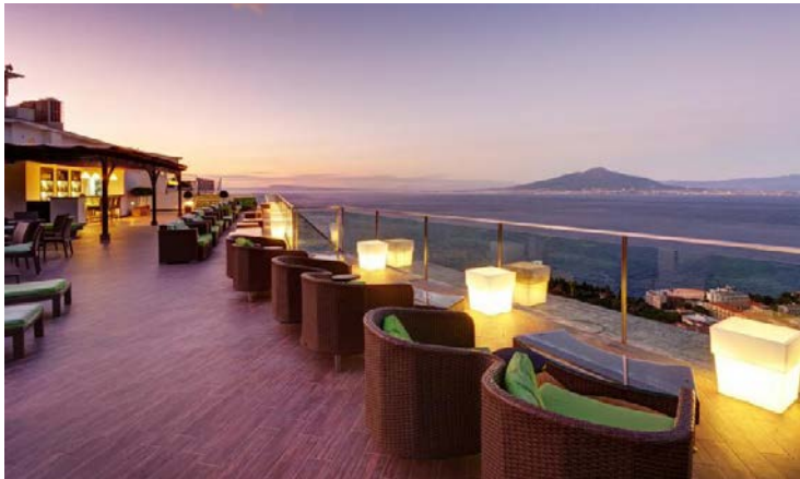
Herrlicher Ausblick von der Dachterrasse