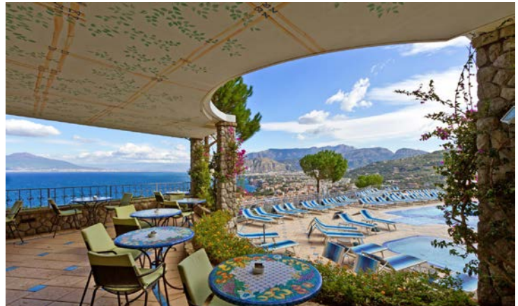
Traumhafter Ausblick von der Poolbar