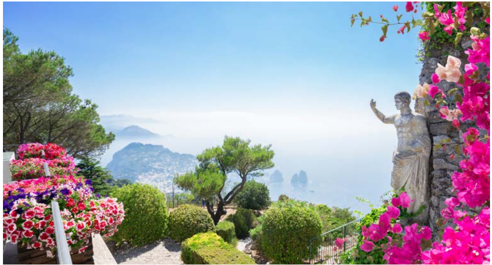
Capri – traumhafte Aussichten von den Augustusgärten

Seit Jahrhunderten inspiriert die Schönheit des Golfs von Neapel Literaten und Musiker aus ganz Europa. Die einzigartige Kulturlandschaft besticht durch prachtvolle Blütengärten, bizarre Felsformationen und ein azurblaues Meer. Verschlungene Küstenstraßen führen durch Orangen- und Zitronenhaine zu Stätten antiker Geschichte. Kampanische Bauern bewirtschaften ihre Gärten und Höfe in der zerklüfteten Küstenlandschaft seit Generationen. Ob Mozzarella oder Limoncello, hier kommen die Gaben der Natur direkt auf den Tisch. Über all dem thront der Vesuv, sagenhafter Mythos und Ehrfurcht erregende Naturgewalt. Idealer Ausgangspunkt, um diesen reizvollen Landstrich Kampaniens intensiv zu erkunden, ist Sorrent. Ein malerischer Ort, der imposant auf einem Felsplateau liegt. Ganz in der Nähe gründeten die Römer die mondäne antike Stadt Pompeji, deren durch Asche konservierte Architektur die Besucher noch heute in die untergegangene Kultur eintauchen lässt. Spätere Könige, Päpste und Fürsten prägten mit dem Bau gotischer Kirchen und barocker Prachtbauten die Altstadt von Neapel. In kleinen Bergdörfern überdauerten zudem die Bauwerke der Normannen und Mauren die Jahrhunderte. Und auf der wohl schönsten Insel des Tyrrhenischen Meeres, auf Capri, finden sich bis heute Spuren früher Bewunderer der einzigartigen Natur. Hier verbrachten im 19. Jahrhundert sowohl der schwedische Schriftsteller Axel Munthe als auch der deutsche Industrielle Friedrich Alfred Krupp ihre wohl schönsten Lebensjahre.